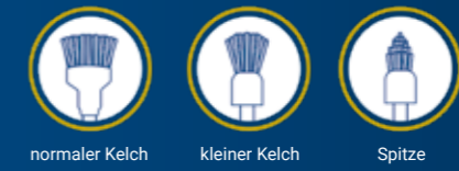
normaler Kelch kleiner Kelch Spitze